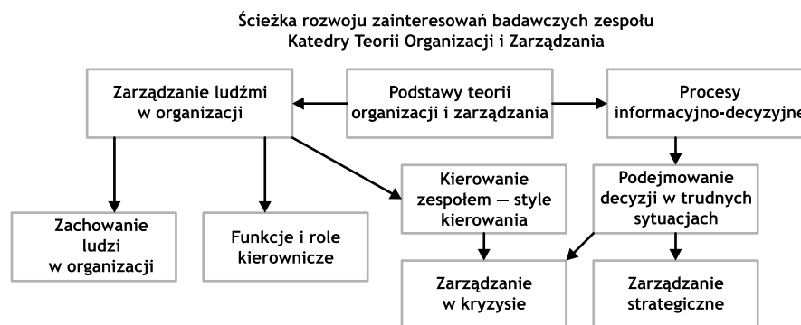
Rys. 2. Ewolucja zainteresowań wewnątrz Katedry Teorii Organizacji i Zarządzania SGPiS/SGH Źródło: opracowanie własne